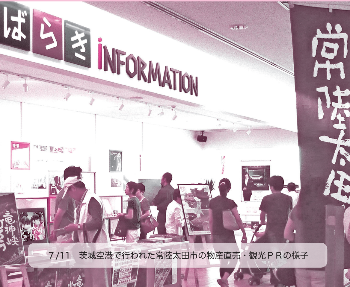
7/11 茨城空港で行われた常陸太田市の物産直売・観光PRの様子

発行 常陸太田市議会 ●責任者 議長 黒沢 義久 ●編集 市議会だより編集委員会 常陸太田市金井町3690番地 ●電話 0294(72)3111(代) FAX 0294(73)1119