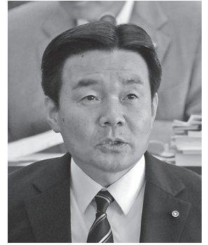
深谷 渉 議員