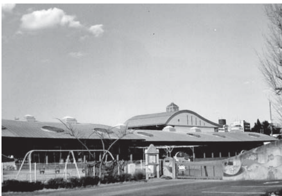
指定管理者制度への移行が進められる愛保育園

答 現在愛保育園に勤める臨時職員はそのまま継続という可能性があるが、現在愛保育園に勤める正職員保育士が他の5園に異動することに伴い、他の5園に勤める臨時職員の多くが来年3月末日を持ってその職を失うものと考えられることから、指定管理者に対しては、現在5園に勤める臨時職員も含めて職のあっせんをお願いしようと考えている。