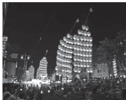
秋田竿燈まつりの様子 一般会計補正予算に、太田まつりへの「秋田竿燈(秋田市)」、「おやま囃子(仙北市)」招へい予算を計上

て、太田まつりに秋田市より「秋田竿燈」、仙北市より「おやま囃子」を招へいする予算として計上したものであるが、その他の事業や式典の内容などについて、庁内のワーキンググループにおいて検討を進めているところである。既に協賛事業やキャッチフレーズの募集、シンボルマークの作製を進めているところであるが、今後7月頃までに記念事業の内容の取りまとめを行い、必要な経費が出る場合には9月補正で対応させていただきたい。