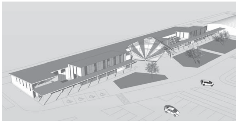
複合型交流拠点施設（道の駅）完成予想図（イメージ）

02㎡、イベント広場や駐車場等は建物の面積の14倍ほどになる。これだけの面積が必要なのか伺いたい。 答 本事業は、事業の趣旨、内容、必要面積等を含め土地収用法による事業認定を受けており、必要な面積と認識している。