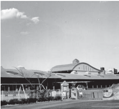
平成27年4月から社会福祉法人仁川会が指定管理者となる愛保育園

申請書の書面の予備審査を行うとともに、申請法人が運営する保育園の現地調査、法人理事や法人を運営する保育園長へのヒアリングを実施し、これらの実施結果に基づいて作成した調査報告書を、選定委員会の審査に付している。審査にあたっては、食育および給食、アレルギー対策、食中毒予防、防災・防犯事故対策等の基本事項について評価対象とするとともに、特に施設の効果が大限に発揮されるという視点から、開園時間及び閉園時間、独自サービスの提案などに重点を置いた審査を行い、その結果として保育サービス提供量が大きいこと、病後児保育、児童クラブの運営について提案があったことなどから社会福祉法人仁川会が選定されたものである。指定管理期間を5年間とした理由としては、愛保育園に民間法人による運営を導入するに当たり、直接民営化の