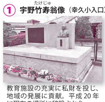
1 宇野竹寿翁像 (幸久小入口)

教育施設の充実に私財を投じ、地域の発展に貢献。平成20年に現在の場所に移設された。