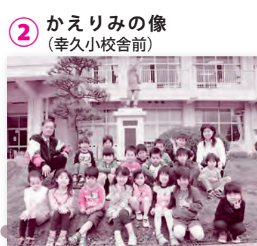
2 かえりみの像 (幸久小校舎前)