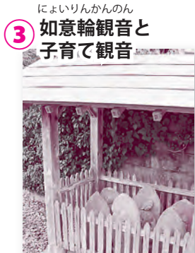
3 如意輪観音と子育て観音

今回の上河合町は、平坦で歩きやすい、まさにてくてくウォークにうってつけの場所です。久慈川の流に抱かれながら、防人の碑や枕石寺、河合神社など史跡も多く、見どころがコンパクトにまとまっています。また、馬頭観世音や観音様なども多くあり、小学校周りは昔の平城の跡だった様子が見て取れます。河合駅で降りて2時間ほどの散策を楽しんでください。車の方は幸久公民館をスタート地点とするとよいでしょう。