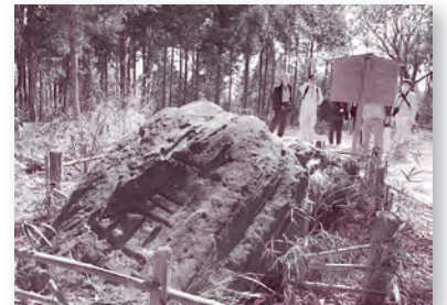
昭和 19 (1944) 年に建立。「雪村」は、室町時代の水墨画家で、刻まれている文字は横山大観の筆によるもの。震災の影響で倒れている。