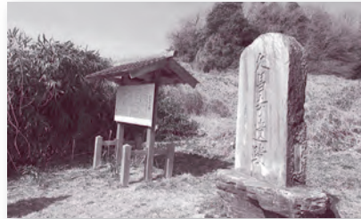
幕末の動乱により荒廃し、明治初期に移転。