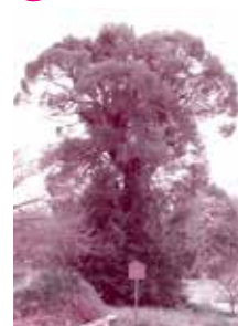
推定樹齢640年で県指定天然記念物。了誉上人が洞にこもった際、このシイの木の実を食べたと伝えられる