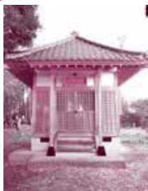
香仙寺の元寺。紅葉も美しい