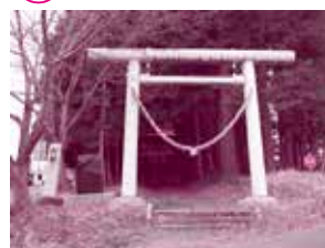
総本社は、鹿嶋市の鹿島神宮。鹿島神宮から勧請して創建され、武甕槌神を祭っている