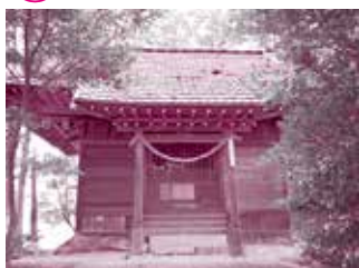
東日本大震災で本殿が被災したが地元の方の手で翌年再建された