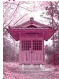
久慈川の水害が多かったため、水の神を祭ったと思われる