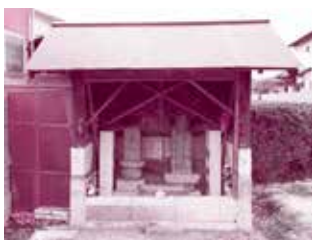
まだら石でできた子安観音像がある