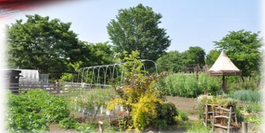
里山ホテルのポタジェ(菜園)でとれた野菜を使った贅沢ランチ!