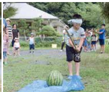
まっすぐまっすぐ!