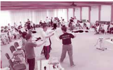
布を使った応急手当法を学ぶ

講習を修了された方々は、今後、応急手当普及員として地域や職場などで応急手当法の普及啓発促進、指導に当たります。