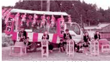
子どもたちの太鼓演奏

7月29日、和田町で不動尊夜町が開催されました。エコミュージアム活動をきっかけに平成23年に夜町を復活させ今年で7回目の開催。当日は、地元の子もたちが、太鼓の演奏や不動尊に続く参道に置く約100個の あんどん 行灯に絵を描くなど夜町を盛り上げました。イベント会場では、地元の方や大学生ボランティアが参加し、流しそうめんや射的などを楽しみ今年も夜町の賑わいを感じることができました。