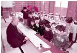
青蓮寺での学習会

学区内にある青蓮寺に伝わる、「豊後国の二孝女物語」の学習を通して、思いやりや優しさ、家族や地域の絆など、豊かな心の育成に努めています。