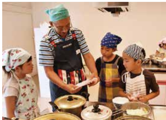
お母さんにお父さん、おじいちゃんも参加

7月26日～8月22日、市内の小学生とその保護者を対象に ぼくとわたしのチャレンジ Cooking が総合福祉会館などで行われました。野菜をたくさん食べるためのコツを学んだ後、ベジヨーグルトなど3品の調理を行いました。みんなで分担を相談したり、ヨーグルトを真剣に分けたりする様子が見られました。