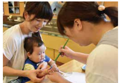
愛保育園でのうち作りの様子