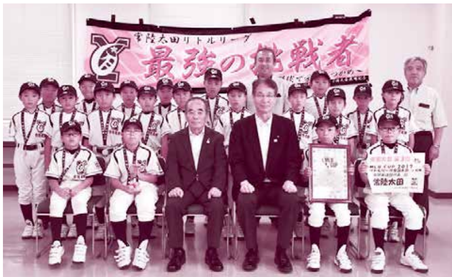
常陸太田リーグのみなさん

7月28日～31日、宮城県石巻総合運動公園などで行われたリトルリーグ全国大会「MLBCUP2017」に常陸太田リーグが出場しました。準決勝では守備が乱れ惜しくも敗退となりましたが、全国で3位という素晴らしい成績を収めました。