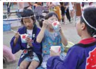
太鼓の衣装がかっこいい!

8月6日、山田小の校庭で納涼ふるさと祭りが行われました。山田地区の各町子ども育成会の子どもたちが太鼓や踊りなどを披露する芸能発表会、水府中吹奏楽部による演奏などが行われました。