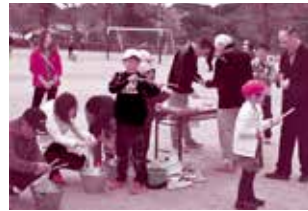
三世代交流で昔遊びに挑戦

豊かな自然や伝統と歴史を生かし、地域の方々の関わりを大切にしながら、多様な体験活動を行い、地域に開かれた学校づくりを進めています。