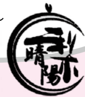
マークも作りました！