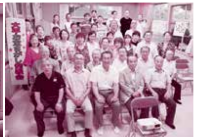
大平のお宝を発表