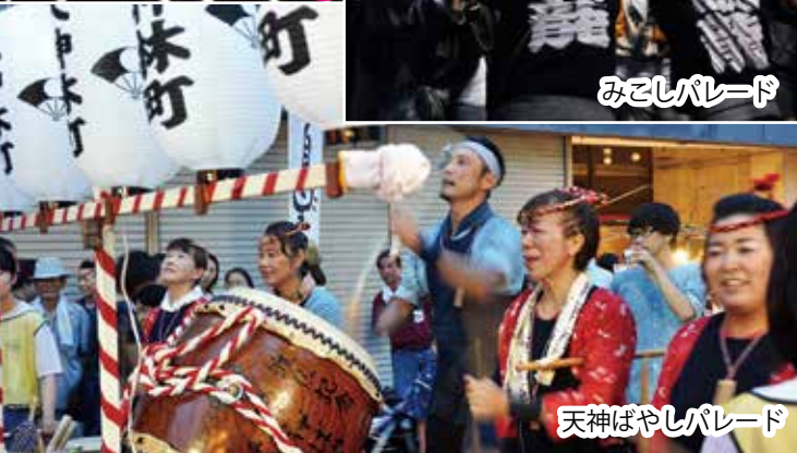
天神ばやしパレード