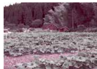
順調に育っています

里川カボチャは、昭和初期から里川地区で栽培されてきた在来作物の一つです。平成 19 年度の地域資源の掘り起こし調査をきっかけに地域特産品と位置づけ、現在、里川カボチャ研究会が中心となり生産者 25 人で原種の復活とブランド化に取り組んでいます。