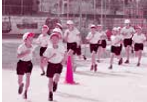
チャレンジタイム「二孝女ラン」

子ども達の活躍の場を大切に、学習や運動の成果、個々の良さや可能性を伸ばす活動を、全職員が一丸となって実践しています。