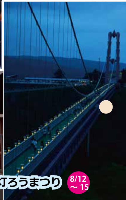
竜神峡灯ろうまつり