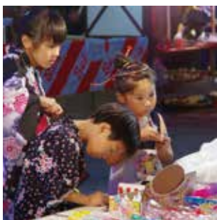
かわいい浴衣姿の子どもたち

8月14日、三才町にある諏訪神社で三才町夏まつりが開催されました。昼間は子どもみこしが町内を練り歩き、夕方からはステージショーがにぎやかに行われました。会場にはさまざまな模擬店が並び、子どもたちは綿あめや射的など、お祭りを堪能していました。