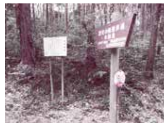
歴史の里遊歩道には傘御殿の看板がある

山一帯は御立山(藩有林)として管理され、馬場町には松茸奉行所までおかれていました。また、光圀の考案で塩付けにされた松茸は、特産品として水戸城下をはじめ江戸にも出荷され、珍重されたそうです。