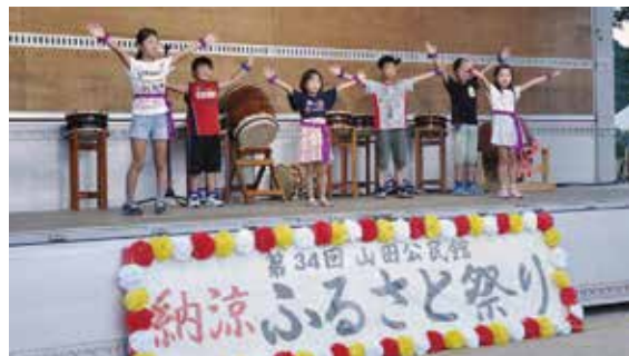
動きがそろったダンス