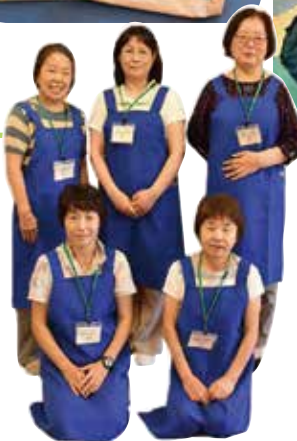
図書館ボランティアの皆さん

赤ちゃんとその保護者に絵本にゆったり親しんでもらうために、ブックスタートの際に読み聞かせや図書館の案内を行っています。赤ちゃんが絵本に関心を示し、驚くお母さんたちも多いです。読み聞かせは、親子の心ふれあう時間となります。布バッグを持ってぜひ図書館にも遊びに来てくださいね。