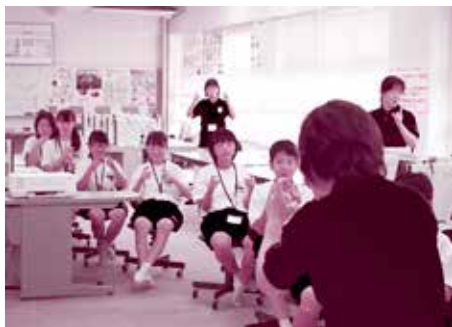
真剣に手話を学ぶ

7月26日・27日、8月8日・22日の4日間、福祉チャレンジセミナーが開かれました。このセミナーは、市内の中学生・高校生を対象に福祉体験やボランティア体験をとおして、高齢者や障がい者等に対する助け合いの心や思いやりの心を育成することを目的に、毎年市社会福祉協議会が開催。7月26日には瑞竜中と水府総合センターで開催され、手話や点字、認知症の方への対応の仕方を学ぶための寸劇などに熱心に取り組んでいました。