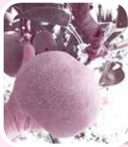
でっかいのができました(^^)

梨の収穫が始まりました♪(´▽`)写真の梨は幸水です！農業の知識など何もなく、教えられたことをしっかり守るくらいしかできない僕がこんな梨を収穫できたのは、全て教えていただいている師匠のおかげです。師匠には、本当に感謝です！この味をぜひ皆さんにも味わっていただきたいです！