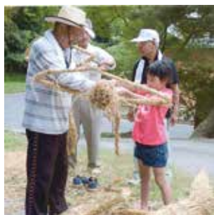
大助人形作りを熱心に教わる

7月29日、機初市民ふれあいセンターで毎年恒例の幡町夏のふるさと祭り（幡町青少年健全育成会主催）が行われました。子どもから大人まで約60人が早朝から集まり、子どもたちは大人から大助人形作りや、まんじゅう作りを教わりました。スイカ割りも行われ、みんなで楽しい夏の思い出を作りました。