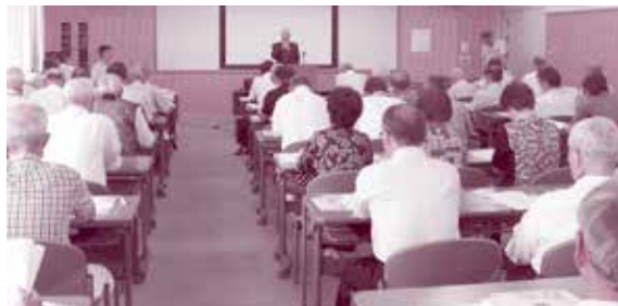
「ノー詐欺」に向けて知識を深める

7月26日、生涯学習センターにおいて、市消費生活センター職員や太田警察署員を講師に招き、市老人クラブ連合会主催による見守りサポーター養成研修会が開催されました。地域全体で被害防止に取り組むノー詐欺運動の一環として開催。当日は、老人クラブ会員50人が参加し、高齢者が詐欺被害に遭わないように、県内における詐欺被害の状況や最近の手口の傾向等について学びました。