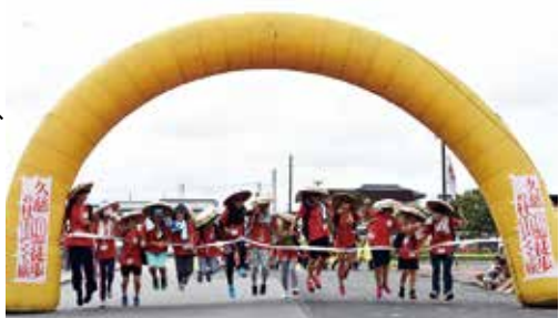
ゴールはみんなでジャンプ！