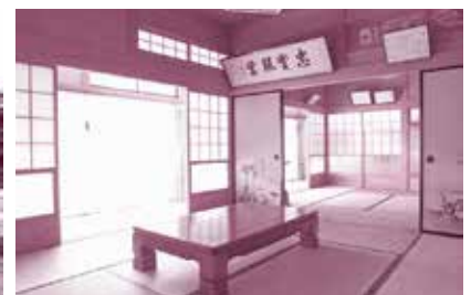
小菅町にあるトライアルハウスの外観⑤と内観⑥