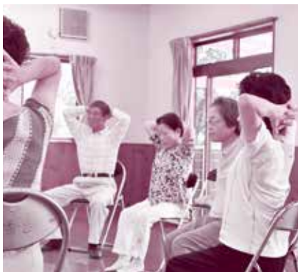
皆さん慣れた様子で身体の動きもスムーズ

白幡台団地では、月に2回シルバリーハビリ体操を行っていて、参加できるときに参加してくださいという気軽な雰囲気大切にしています。平成24年にいきいき健康運動教室を開催してから、自主グループとして活動していたこともあり、皆さん自分の体のために進んで参加してくれています。特に一人暮らしの参加者の方は「健康でいなくては」という意識が高いように感じています。