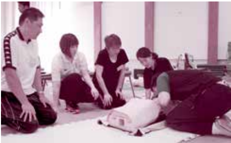
心肺蘇生法の講習

この講習は、応急手当の方法を普及啓発する指導者を養成するもので、今回の講習には、県北地区からさまざまな職種の方30人が参加しました。 講習では、救急救命士から指導を受け、心肺蘇生法、AED使用方法、気道異物除去法、止血法などの応急