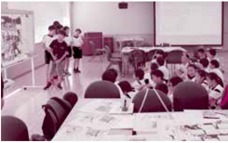
各学校でまとめた意見を発表し、意見を交換。いろいろな意見を聞き交流を深めた

クラブ員たちは、119番通報訓練や放水体験、救助技術体験や救急訓練（心肺蘇生法）、災害対応訓練等を行いました。災害対応訓練では、災害発生時の風景をイメージし日常の生活に潜む危険について考えることで自分の命の守り方を学びました。