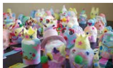
自由な発想の傑作がずらり