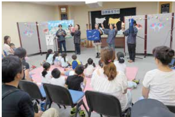
楽しい人形づくりにくぎづけ

8月6日、図書館で 図書館まつり が開催されました。図書館ボランティアによる絵本の読み聞かせ・本の修繕・点字体験・しおり作りなど、各コーナーにはたくさん親子連れが訪れ、本との触れ合いを楽しみました。