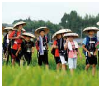
元気にピースサイン

8月8日～12日、 久慈の杜 100km 徒歩の旅 が行われました。第10回となる今回は、小学4～6年生91人が参加。5日間かけて常陸大宮市や太子町を含む100kmの行程を完歩しました。ゴールに姿を見せた子どもたちは、疲れも感じさせず、喜びと自信に満ちた表情をしていました。