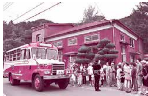
奥茨城村役場の旧町屋変電所とボンネットバス

7月29日、道の駅ひたちおおたオープン1周年を記念して、連続テレビ小説「ひよっこ」にも登場したボンネットバスが市内を走りました。道の駅ひたちおおたを出発し、梅津会館に立ち寄りながら、「ひよっこ」のロケ地である旧町屋変電所と地徳橋を巡りました。走るボンネットバスを見かけた人たちはびっくりしながらも大きく手を振ってくれました。