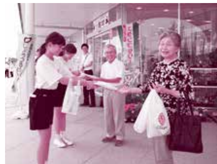
笑顔で呼びかける中学生

7月25日、第67回“社会を明るくする運動”キャンペーンが、道の駅ひたちおおたにおいて行われました。この取り組みは、久慈地区保護司会常陸太田支部が中心となり、青少年の健全育成を目的に犯罪や非行のない安全・安心な地域社会を築くための取り組みとして毎年行われているもの。このキャンペーンに参加した峰山中の生徒たちは、元気な声で買い物客に啓発チラシやティッシューパーなどを配布し呼びかけました。