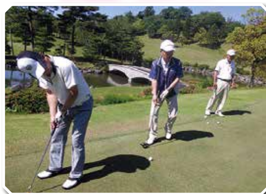
ポイントはパッティング!