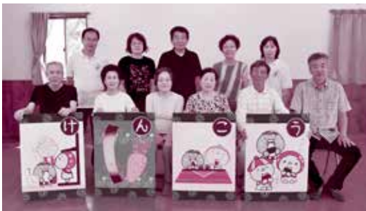
里美健康かるたの大型版と。「実物のかるたはこんなに大きくないですよ！」

重点地区活動をした平成27年度には、健康と里美の昔話をテーマにした里美健康かるたを作成しました。保健推進員のほか、食生活改善推進員さんにも参加していただき、みんなで内容を考えました。イラストは元アーティストインレジデンスのなるさんに描いていただき、かわいらしいかるたが出来上がりました。このかるたも活用していきたいです。今後は、外に出かける活動もできたらと思っています。今まで参加していない方が参加するきっかけになるといいなと思っています。