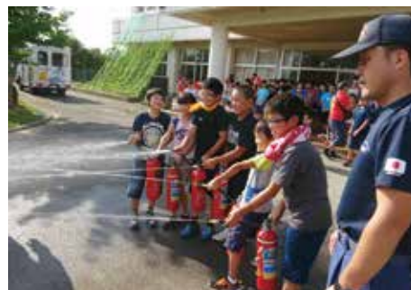
狙いを定めて水消火器で消火！

8月5日・6日、 久米小で夏休み防災キャンプ （久米小PTA・おやじの会主催）が行われました。市消防本部協力のもと、消火訓練や救急救命法、煙体験などを行い、災害時の対応を学びました。夕食は、米を研がずに茹でただけで炊き上げができる簡易炊飯袋を使って炊飯をし、保護者の協力で牛丼を作りました。夜は、肝試しと花火を行い、子どもたちの歓声がわき起こる楽しいひと時を過ごしました。