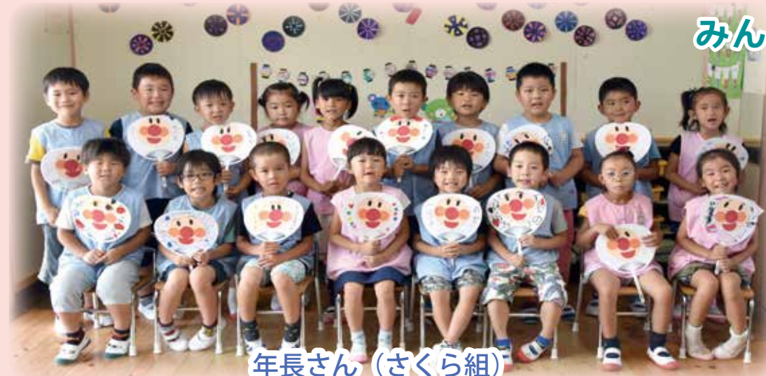
年長さん(さくら組)

手作りのうちわで夏祭りに盆踊りを踊ったよ。みんなで楽しい夏の思い出になりました!