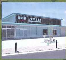
常陸太田市 / 道の駅ひたちあおぞら

[申込み・問合せ] 常陸太田市観光振興課 〒313-0013 常陸太田市山下町 949-9 ☎0294-72-8071 Mail: shokan2@city.hitachiota.lg.jp