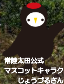
常陸太田公式 マスコットキャラクター じょうづるさん

常陸太田市は茨城県の北部にあって県都水戸市から北へ20キロ、東京から120キロ圏に位置しています。 豊かな自然環境にあり、平野部は温暖で冬季に雪が降ることはほとんどありません。 徳川光圀公が晩年を過ごした西山荘など、古く戦国時代から続く歴史と文化にあふれた地域であり、古いたたずまいと新しい文化とが融和したまちです。 ※物件は里美地区の静かな山間にある住宅です。