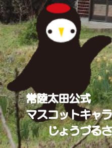
常陸太田公式 マスコットキャラクター じょうづるさん

常陸太田市は茨城県の北部にあって県都水戸市から北へ20 キロ 、東京から120 キロ 圏に位置しています。 豊かな自然環境にあり、平野部は温暖で冬季に雪が降ることはほとんどありません。 徳川光圀公が晩年を過ごした西山荘など、古く戦国時代から続く歴史と文化にあふれた地域であり、古いただずまいと新しい文化とが融和したまちです。 ※施設は市街地から離れた静かな里山にあります。