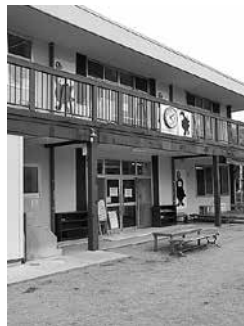
子育て支援施設 じょうづるはうす (新宿町)

問 特定非営利法人結を選定するうえで特に評価した点について伺いたい。 答 本市の施設設置の意図に沿った運営内容を評価し選定したものである。