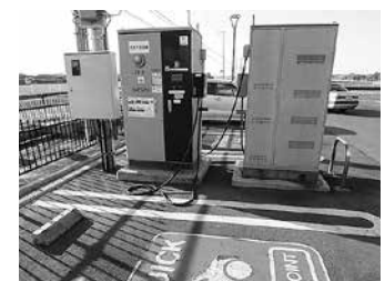
道の駅ひたちおおたEVスタンド

答1 電気自動車用充電器の仕様は、すべて同一の仕様を予定している。電気自動車が30分間で80%充電できる最大出力50キロワットの急速型充電設備を置き、現在、道の駅ひたちおおたに設置している電気自動車用充電器と同性能のものとなる。