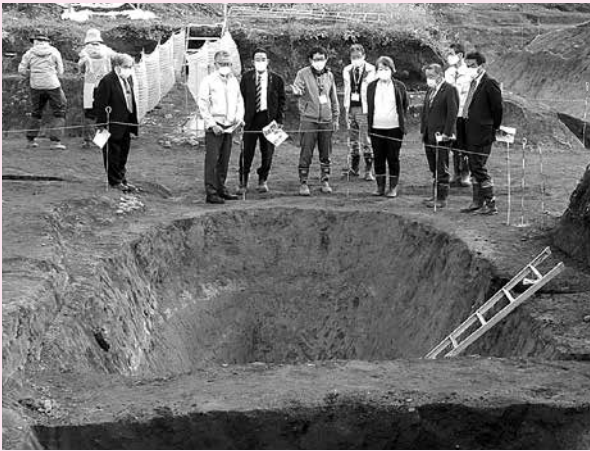
写真：10月21日、文教民生委員会所管事務調査として、JT跡地内太田城跡埋蔵文化財発掘調査の状況を視察