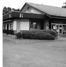
高齢者生産活動センター (大中町)

答 維持管理について、これまで同様対応していくが、40年を経過した施設であるので移転も含めた対応を検討している。