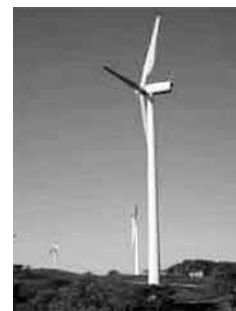
里美風力発電施設 （里川町）

1円であり、建設費については2億2千万円で、そのうち2分の1を新エネルギー・産業技術総合開発機構の補助金で建設されたものである。