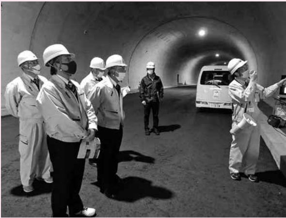
写真：11月13日、産業建設委員会所管事務調査として、折橋町地内の国道461号(仮称)北沢トンネル整備工事の進捗状況等を視察