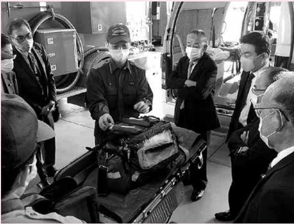
写真：11月17日、総務委員会所管事務調査として、南消防署においてコロナ禍における傷病者等の緊急搬送の対応状況を視察