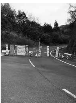
市道0126号線グリーンふるさとライン (町屋町)

答 現在災害復旧工事として、法枠工を施工中であり、3月には完成する予定で進めている。