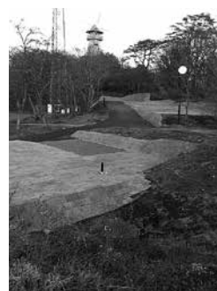
里美オートキャンプ場 (里川町)

答 県内10カ所のオートキャンプ場を調査し、敷地内の施設等が類似する桜川市などの3施設及び本市の水府竜の里公園の利用料金を勘案し設定したものである。