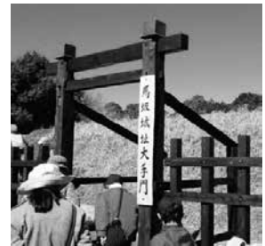
市民提案型まちづくり事業

答1 事業内容は、『下大門町地内及び天神林町地内において佐竹氏ゆかりの城跡の整備やハイキングコース整備』『磯部町地内においては寺跡の公園整備』『新宿町地内においては源氏川堤防沿いに彼岸花の植栽をする』など地域資源の磨き上げを行い、交流人口の拡大などを図る活動をしている。また、コロナ禍での事業の影響については、源氏川の彼岸花鑑賞会など集客を伴う事業の一部には中止となった事業がある。