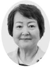
宇野 隆子 議員