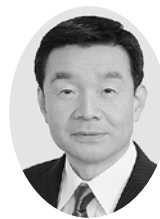
深谷 渉 議員

令和3年3月31日をもって任期が満了となることに伴い、本会議（3月19日）において選挙が行われ、次のとおり当選人が決定しました。