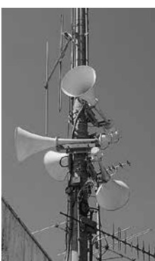
屋外拡声子局スピーカー

さらに、情報伝達の新たな手段 として、スマートフォンアプリも 合わせて整備することとしてお り、高齢者等のスマートフォンを 持たない方や対応が困難な方への 情報伝達として、事前登録され た 方を対象に防災行政無線の放送内