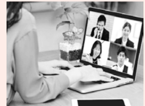
テレワーク施設整備の補助