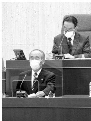
施政方針を説明する 大久保 太一 市長

た取り組みを進め、刻々と変化する社会経済情勢や複雑多様化する市民ニーズに、柔軟かつスピード感を持って対応していかなければならないと考えております。 引き続き、本市の目指す将来像「幸せを感じ、暮らし続けたいと思うまち常陸太田」の実現を目指してまいります。