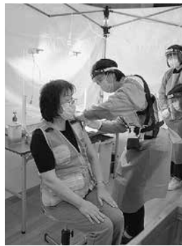
新型コロナウイルスワクチン集団接種模擬訓練

答 国は新型コロナウイルスワクチン接種を7割と想定しているが、より多くの市民の方に接種を受けていただける体制の実施計画を整備している。現在、市内すべての医療機関において協力を頂ける体制をとり、各地区において集団接種を実施に向けて準備を進めており、3月25日には、新型コロナウイルスワクチン集団接種模擬訓練を実施していく。