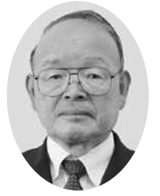
菊池 伸也 議員