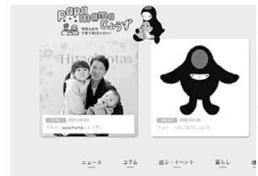
「papa mama じょうず」サイト

答 委託料の内容は、子育て支援イベントとして保護者向けの映画の上映会と音楽で楽しめるオンラインアート遊びとホームページ上に公開している子育て世代向けのウェブマガジンサイト「papa mama じょうず」の作成委託料である。