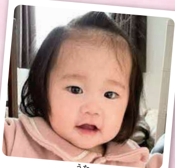
うた 我妻 唄多ちゃん 1月21日生まれ/宮本町