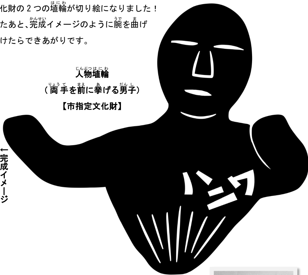
じんぶつはにわ 人物埴輪 (両手を前に挙げる男子) 【市指定文化財】

市指定文化財の2つの埴輪が切り絵になりました！ 切り抜いたあと、完成イメージのように腕を曲げて貼りつけたらできあがりです。