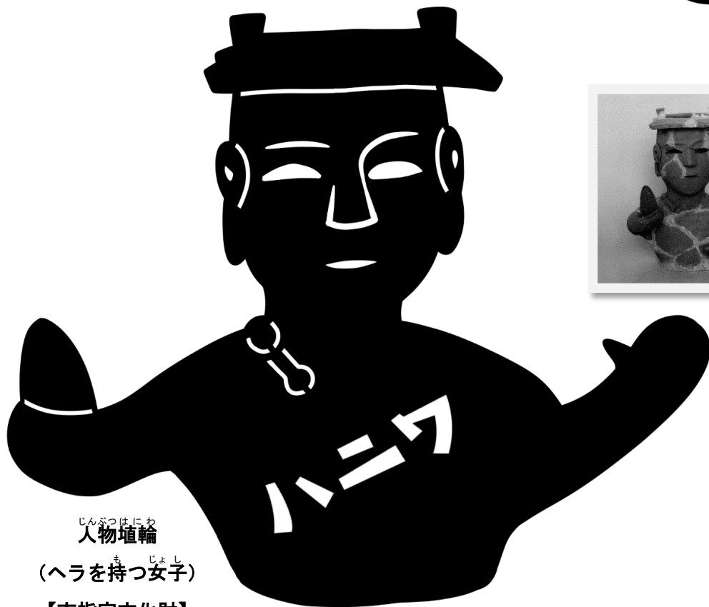
じんぶつはにわ 人物埴輪 (へらを持つ女子) 【市指定文化財】