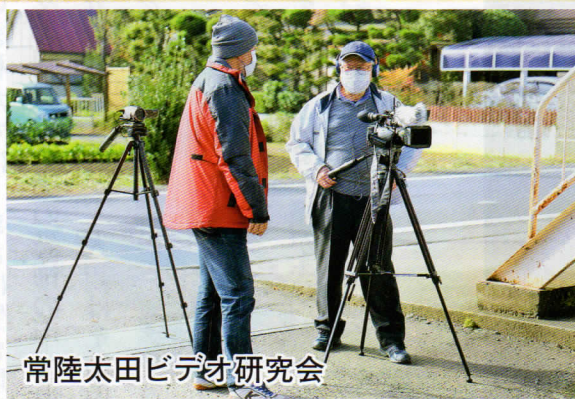
常陸太田ビデオ研究会