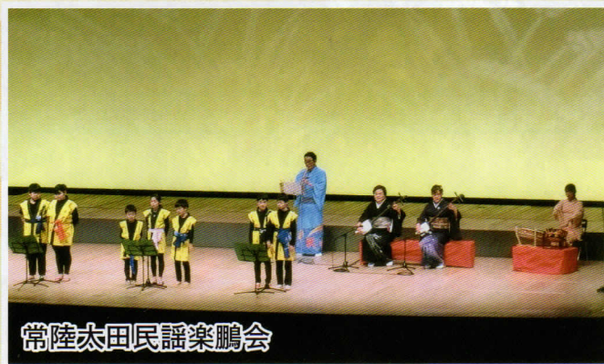
常陸太田民謡楽鵬会