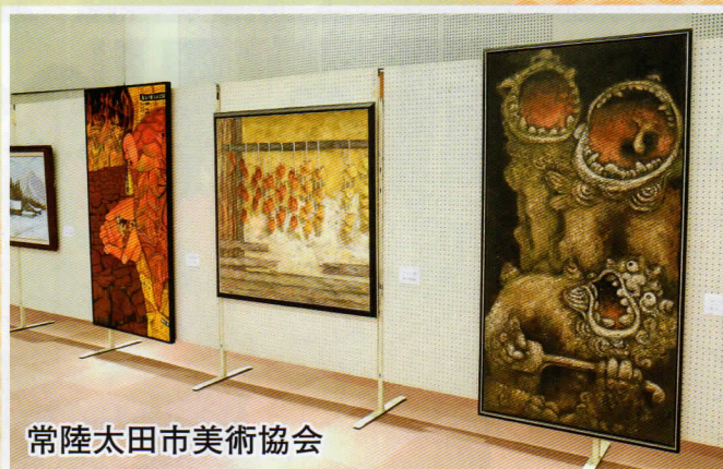
常陸太田市美術協会