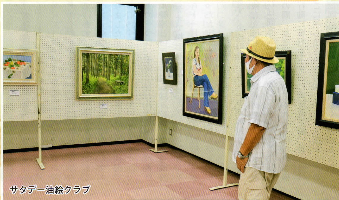
サタデー油絵クラブ