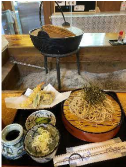
常陸秋そばに舌鼓

実際に住んでみて、市民の皆様も暖かく、生活の知恵などを教えて頂いたり、毎日、新しい発見があります。交流を深めて、常陸太田ライフを楽しみます！