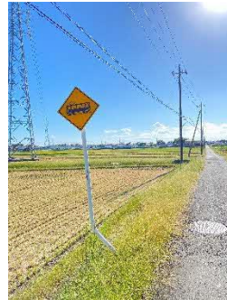
のどかな日常の景色