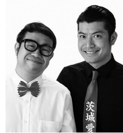
すいたんすいこう