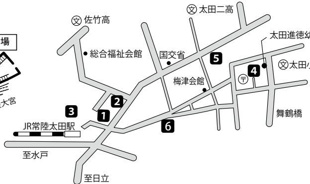
【市営駐車場位置図】