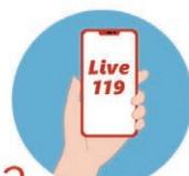
2 メッセージに書かれているURLにアクセスします。