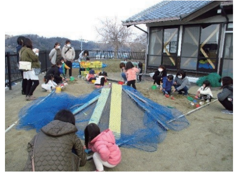
*太田進徳幼稚園での様子