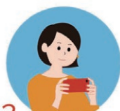
3 画面の案内に従って操作し、撮影を開始します。