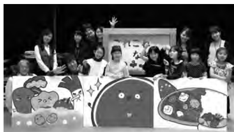
おつきなおつきな紙芝居「これこれなあに？」