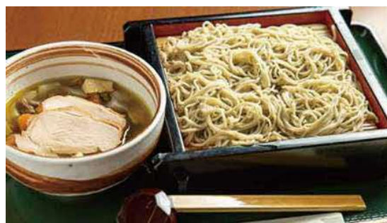
〈期間限定メニュー〉 旅するシェフのコンソメ洋風つけけんちん （そば店「夢玄」にて提供 午前11時～午後3時）