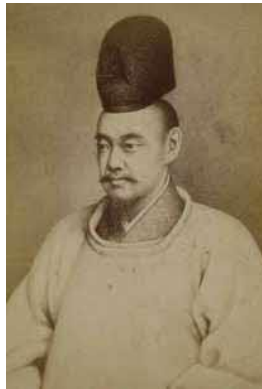
斉昭肖像画写真(県立歴史館蔵)

県立歴史館企画展3(アーカイブス展) 徳川斉昭と弘道館・偕楽園 水戸藩9代藩主徳川斉昭によって創設され、日本遺産にも認定された弘道館と偕楽園は、斉昭の獨創性が発揮された、他に類を見ない施設です。斉昭に関する資料を交えてその特色を紹介します。