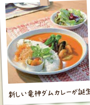
新しい竜神ダムカレーが誕生