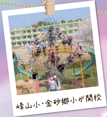
峰山小・金砂郷小が開校