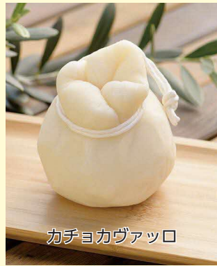
カチヨカヴァッコ