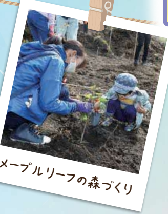
メープルリーフの森づくり