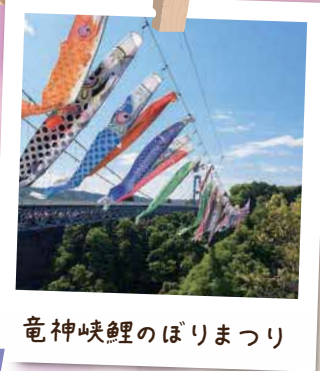
竜神峡鯉のぼりまつり