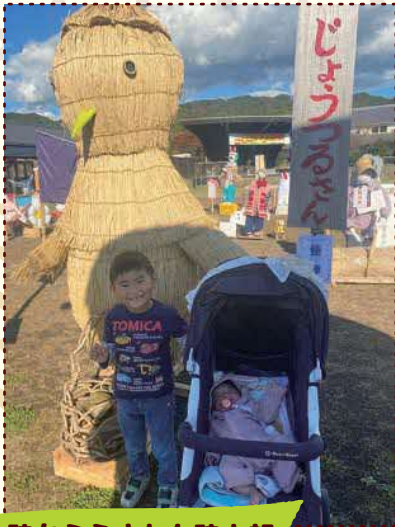
陸からうまれた陸太郎