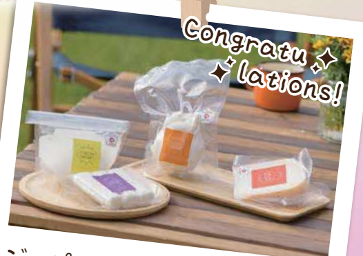
ジャパンチーズアワードで金賞