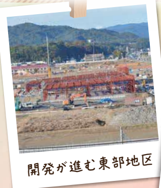
開発が進む東部地区