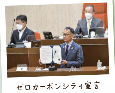
ゼロカーボンシティ宣言