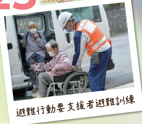
避難行動要支援者避難訓練