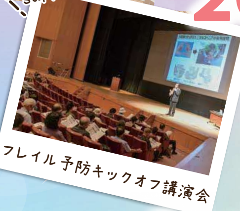
フレイル予防キックオフ講演会