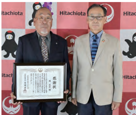
(左から橘さん、宮田市長)