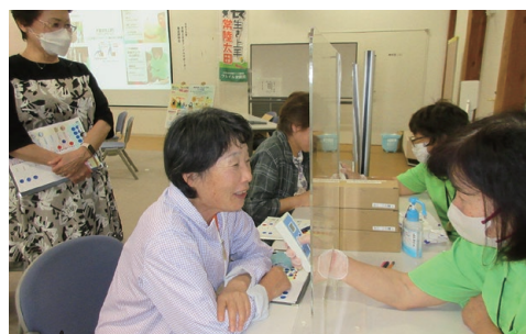
滑舌の測定や噛む力の測定を行って自分のお口の健康状態を確認します。

フレイル対策室では、専門職によるフレイル予防についての健康教室などを行っています。内容や申し込みについては、お問い合わせください!