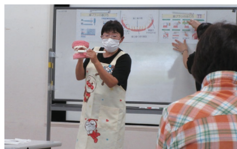
歯科衛生士の方に正しい歯の磨き方などのお話をいただきました。