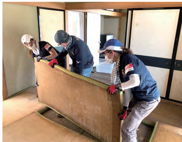
浸水したたみを運び出す