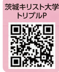
茨城キリスト大学 トリプルP

◆問：茨城キリスト教大学 カウンセ リング子育て支援センター（52・32 15）/メール anne@icc.ac.jp