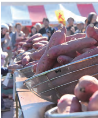
東海村 観光協会 ホームページ

◆問：東海I〜MOのまつり運営協議会（東海村観光協会内） 029・287・0855