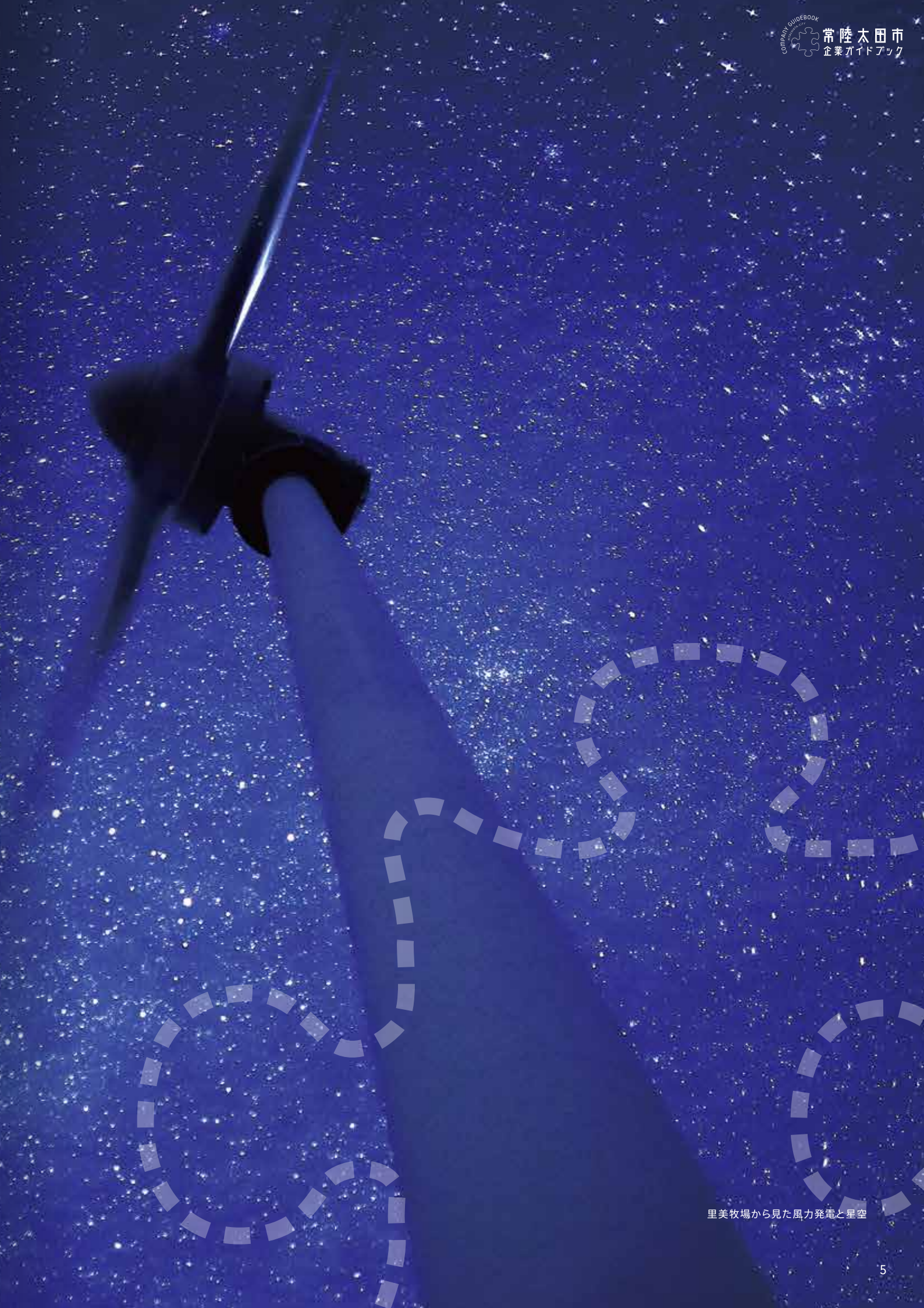
里美牧場から見た風力発電と星空