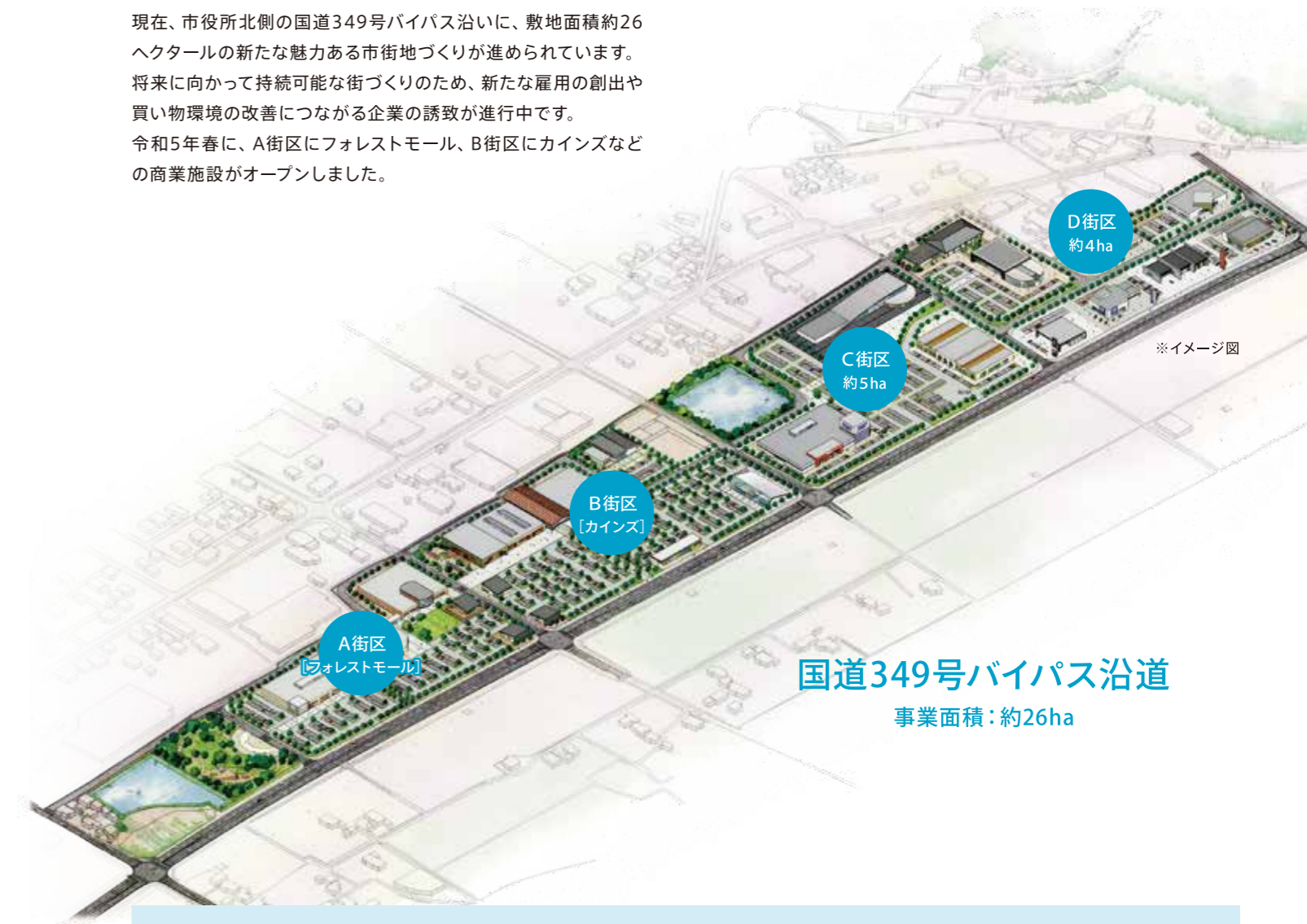
国道349号バイパス沿道 事業面積：約26ha

現在、市役所北側の国道349号バイパス沿いに、敷地面積約26ヘクタールの新たな魅力ある市街地づくりが進められています。将来に向かって持続可能な街づくりのため、新たな雇用の創出や買い物環境の改善につながる企業の誘致が進行中です。令和5年春に、A街区にフォレストモール、B街区にカインズなどの商業施設がオープンしました。