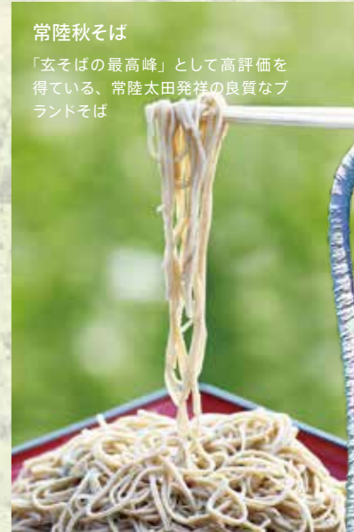
常陸秋そば 「玄そばの最高峰」として高評価を得ている、常陸太田発祥の良質なブランドそば