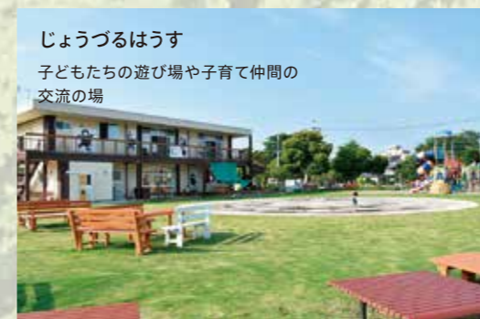
じょうづるはうす 子どもたちの遊び場や子育て仲間の交流の場