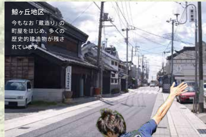
鯨ヶ丘地区 今もなお「蔵造り」の町屋をはじめ、多くの歴史的建造物が残されています。

市域南端を流れる久慈川の支流である、里川、山田川、浅川が南北を貫流し、その流域沿いには多くの集落が形成され、上質なコシヒカリの産地としての水田地帯が広がっており、地域産業の中核を担うとともに、ぶどうや梨などの特産物の生産地でもあります。また、山間部である北部を中心に、林業、畜産業や常陸秋そばなどが地場産業として栄えています。