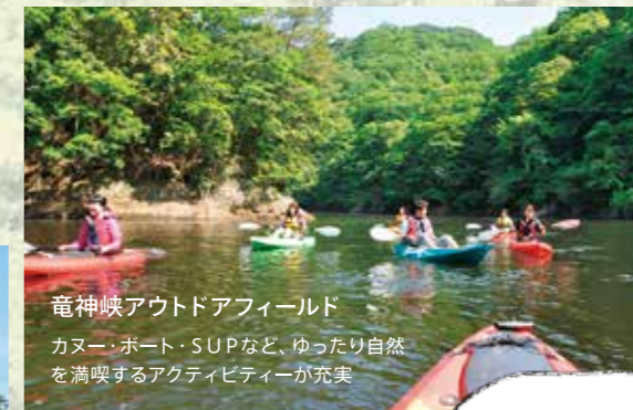
竜神峡アウトドアフィールド カヌー・ボート・SUPなど、ゆったり自然を満喫するアクティビティーが充実