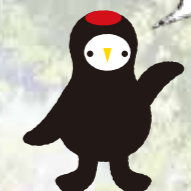
常陸太田市公式 マスコットキャラクター 「じょうづるさん」