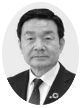
深谷 渉 議員

問1 年間1万人以上の女性が罹患し、3千人近くが亡くなっている子宮頸がん。現在のワクチン接種状況を伺いたい。また、世界40か国で公費助成されている男性へのHPVワクチン接種は、肛門がんや咽頭がん等から男性を守り、将来のパートナーへの感染を防ぐ。男性へのHPVワクチンの任意予防接種と助成制度について伺いたい。