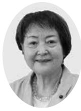
宇野 隆子 議員

答2 教育部長 本年度より学齢簿システムを本格稼働している状況で、今後、このシステムに給食費納入システムを連携させて、学校給食費の徴収事務を、学校から市教育委員会へ移行する準備を進めている。学校給食費の徴収・管理を市が行う公会計化は、教職員の業務負担軽減等にもつながるので、すでに徴収事務を市に移行している自治体の事例を調査し、その実現に取り組んでいく。