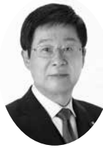
平山 晶邦 議員

チームで活動し、月4回程度のクラブ活動のうち月2回を全員での合同練習にあてている。今後の地域移行の取り組みについては、令和7年度までの3年間程度でチーム編成が困難となるバレーボール、サッカー、バスケットボールを優先して計画的に進めていく。特にバレーボールについては、今年度中の地域移行に向けて準備を進めているところである。