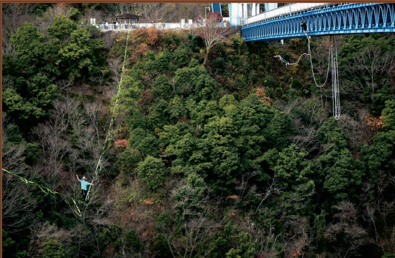
第9回常陸太田市フォトコンテスト入賞作品 「峡谷の共演」／撮影場所：竜神大吊橋