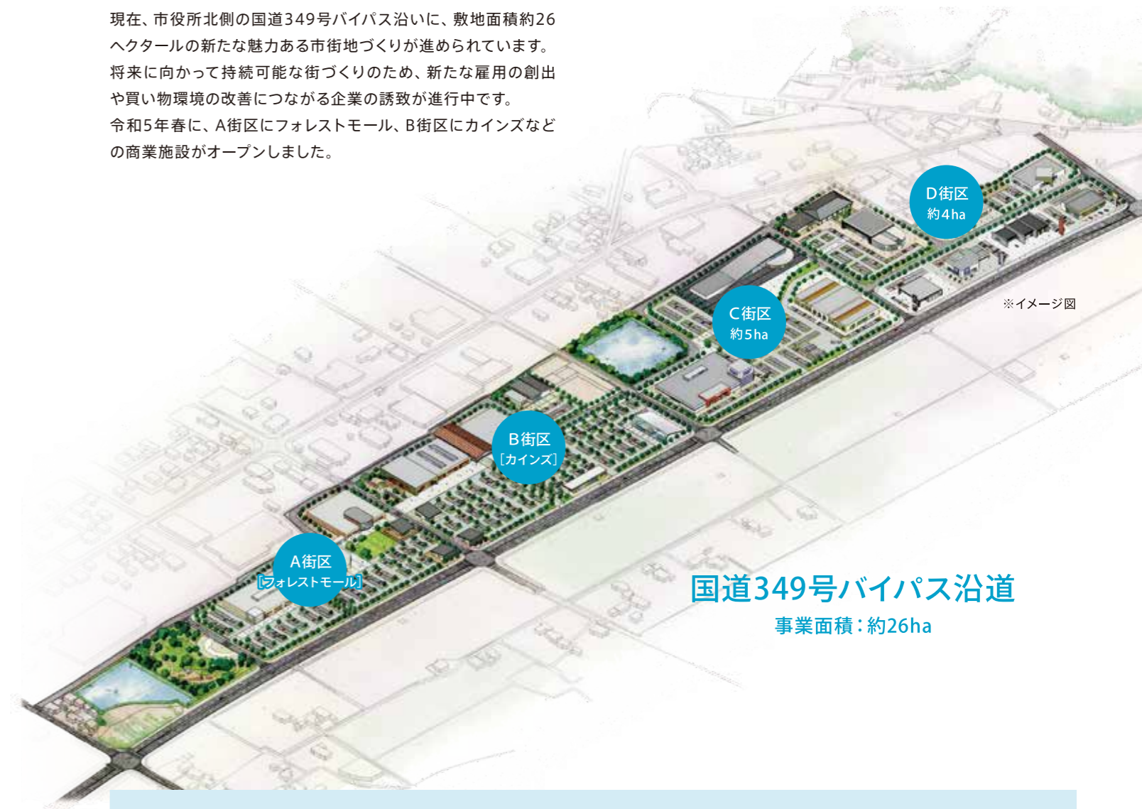
国道349号バイパス沿道 事業面積：約26ha

現在、市役所北側の国道349号バイパス沿いに、敷地面積約26ヘクタールの新たな魅力ある市街地づくりが進められています。将来に向かって持続可能な街づくりのため、新たな雇用の創出や買い物環境の改善につながる企業の誘致が進行中です。令和5年春に、A街区にフォレストモール、B街区にカインズなどの商業施設がオープンしました。