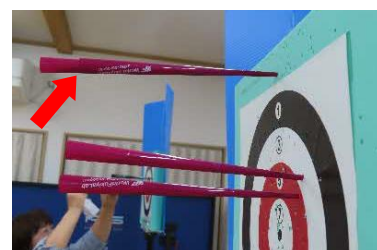
ダブルに重なった矢（1名）