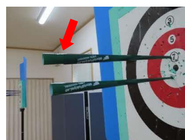
ダブルに重なった矢（4名）

②日 時：10月8日（火） 場 所：小沢町集会所 サロン・小沢会 11名 推進委員 3名