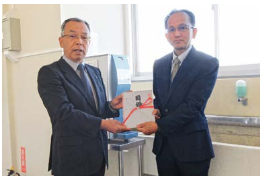
常陸太田ロータリークラブ様より 冷水機 (太田中学校に設置)