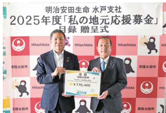
明治安田生命保険相互会社 水戸支社様より 770,400円