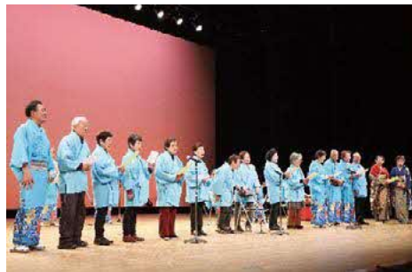
令和7年の開催時の様子