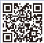
(一社)県建築士事務所 協会ホームページ (申込フォーム)