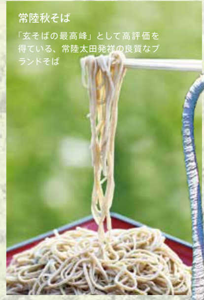
常陸秋そば 「玄そばの最高峰」として高評価を得ている、常陸太田発祥の良質なブランドそば