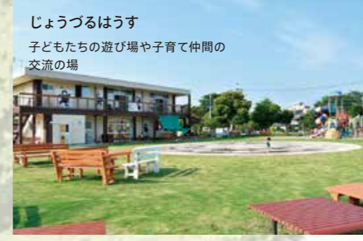
じょうづるはうす 子どもたちの遊び場や子育て仲間の交流の場