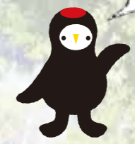
常陸太田市公式 マスコットキャラクター 「じょうづるさん」