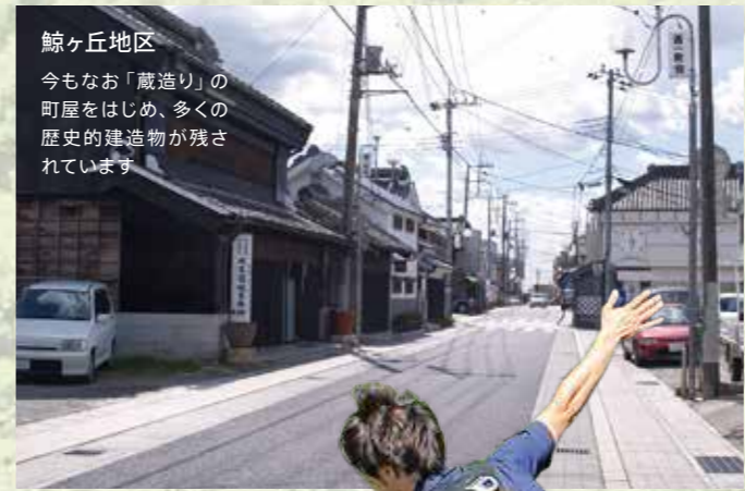
鯨ヶ丘地区 今もなお「蔵造り」の町屋をはじめ、多くの歴史的建造物が残されています。

市域南端を流れる久慈川の支流である、里川、山田川、浅川が南北を貫流し、その流域沿いには多くの集落が形成され、上質なコシヒカリの産地としての水田地帯が広がっており、地域産業の中核を担うとともに、ぶどうや梨などの特産物の生産地でもあります。また、山間部である北部を中心に、林業、畜産業や常陸秋そばなどが地場産業として栄えています。