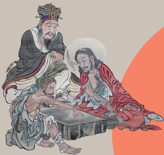
河鍋暁斎「三聖図」(部分)