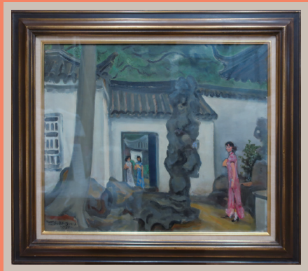
熊岡美彦「留園静閑 (蘇州)」