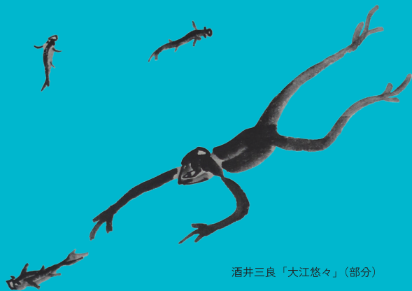
酒井三良「大江悠々」(部分)