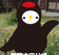
常陸太田公式 マスコットキャラクター じょうづるさん

常陸太田市は茨城県の北部にあって県都水戸市から北へ20 キ 、東京から120 キ 圏に位置しています。 豊かな自然環境にあり、平野部は温暖で冬季に雪が降ることはほとんどありません。 徳川光圀公が晩年を過ごした西山荘など、古く戦国時代から続く歴史と文化にあふれた地域であり、古いたずまいと新しい文化とが融和したまちです。 ※施設は市街地から離れた静かな里山にあります。