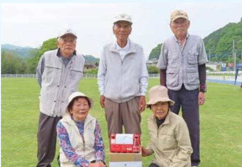
瑞龍白鷺会の皆さん