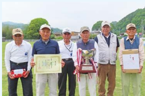
茅根丸山会の皆さん