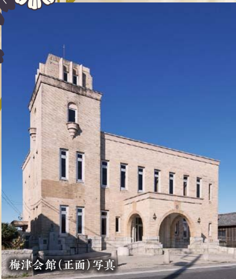
梅津会館(正面)写真