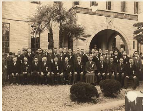
▲ 竣工式での集合写真