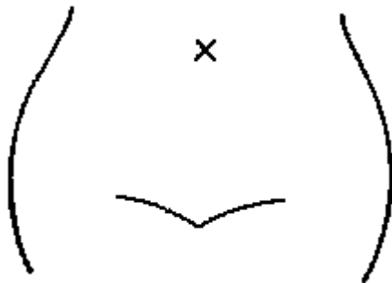
(ストマ及びびらんの部位等を図示)